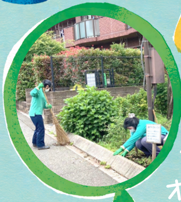
公園 オフィス 清掃